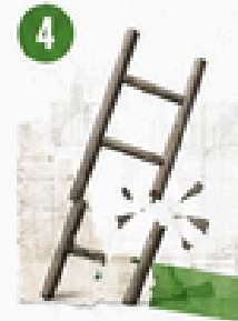
4 Educación media