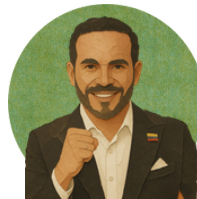
Abelardo de La Espriella

No tiene propuestas en su plan de gobierno sobre este aspecto.