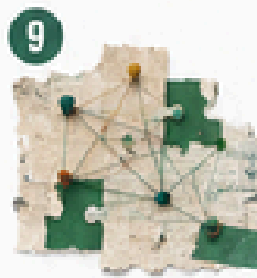
9 Capacidades territoriales