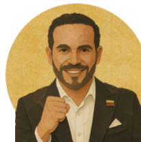
Abelardo de La Espriella

No tiene propuestas en su plan de gobierno sobre este aspecto.