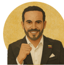
Abelardo de La Espriella

No tiene propuestas en su plan de gobierno sobre este aspecto.