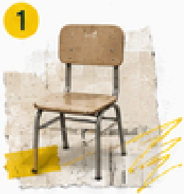
1 Educación inicial