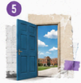
5 Acceso a educación superior