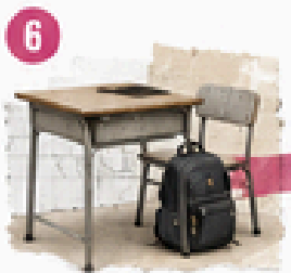
6 Permanencia educativa