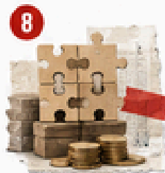
8 Gasto educativo