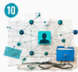
10 Información y datos