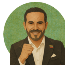
Abelardo de La Espriella

No tiene propuestas en su plan de gobierno sobre este aspecto.