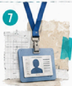
7 Docentes y carrera profesional docente